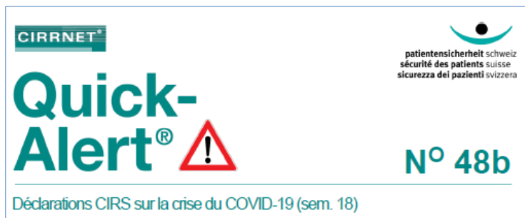
Illustration 3 : En-tête de la Quick-Alert® N° 48b

Cette deuxième Quick-Alert liée au COVID-19 abordait le problème du maintien en activité dans les établissements de santé et de soins de personnel ayant des symptômes laissant suspecter une infection et proposait des recommandations à ce sujet. Les déclarations enregistrées montraient une nouvelle fois que les institutions étaient confrontées au défi de réagir avec souplesse aux conditions changeantes tout en appliquant les règles de sécurité. Dans cette Quick-Alert, la Fondation a présenté une aide à la décision pouvant servir de référence.