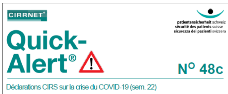
Illustration 4 : En-tête de la Quick-Alert® N° 48c

De nombreuses déclarations CIRS relatives à la gestion de la pandémie rapportent des événements critiques en lien avec des problèmes de communication relatifs au diagnostic en cours / diagnostic requis ainsi qu'au statut d'infection et de suspicion d'infection. On constate que ces problèmes surviennent le plus souvent aux interfaces entre les services ou les secteurs de prise en charge. Rien d'étonnant à cela : bien que la menace du COVID-19 soit très présente à l'esprit de tout le personnel sanitaire et que les procédures liées à cette problématique soient désormais bien établies, les nombreuses adaptations requises ont nécessité de s'écarter fortement de la routine mise en place depuis de longues années. Il est donc recommandé d'utiliser des outils attestés dans la pratique qui garantissent une communication sûre dans la prise en charge des patients.