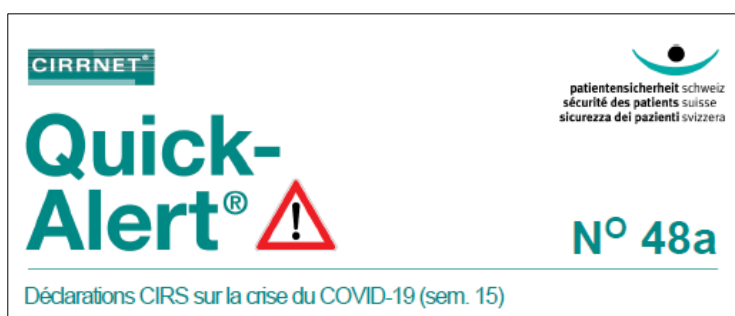
Illustration 2 : En-tête de la Quick-Alert® N° 48a

Peu après l'ouverture de la plateforme de déclaration, de premiers signalements ont été recueillis concernant des problèmes relatifs à la pandémie de COVID-19. Ceux-ci faisaient état d'un recul sensible du recours aux prestations sanitaires, en particulier des médecins de famille et des services de soins à domicile, mais aussi de difficultés liées à l'adaptation constante des directives internes, des recommandations spécifiques et des dispositions réglementaires pour les professionnels de santé.