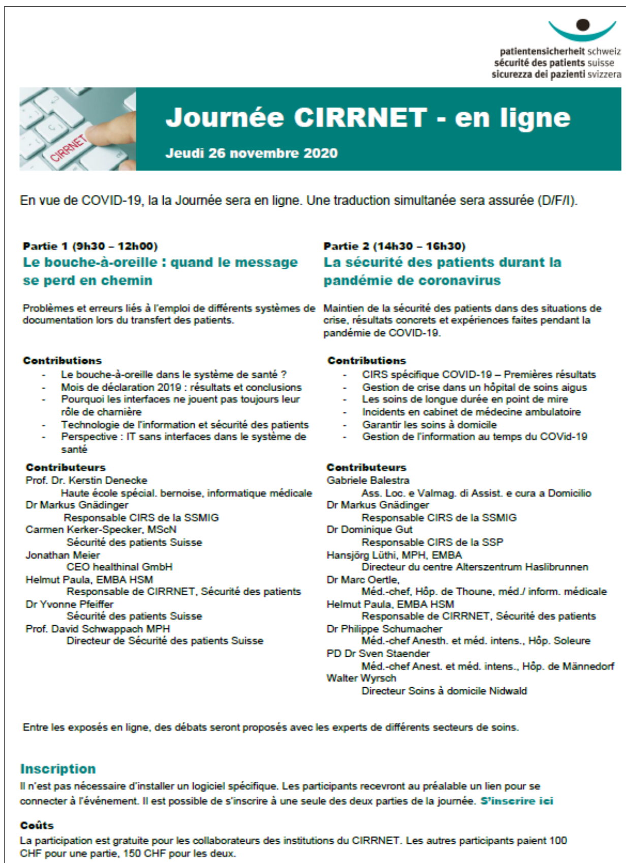
Illustration 5 : Journée CIRNET 2020 : programme et intervenants