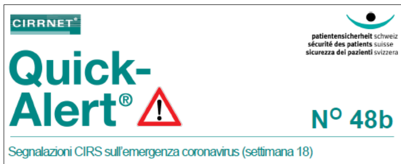
Figura 3: intestazione Quick-Alert® n. 48b

Nel secondo Quick-Alert dedicato all'emergenza Covid-19, sono state formulate raccomandazioni sull'impiego di collaboratori con sintomi sospetti negli istituti sanitari e di cura. Le segnalazioni inoltrate hanno di nuovo dimostrato la necessità degli istituti di reagire in modo flessibile all'evolvere della situazione e di rispettare le regole di sicurezza. In tale ottica, è stato presentato un ausilio per la procedura decisionale in grado di fungere da orientamento.