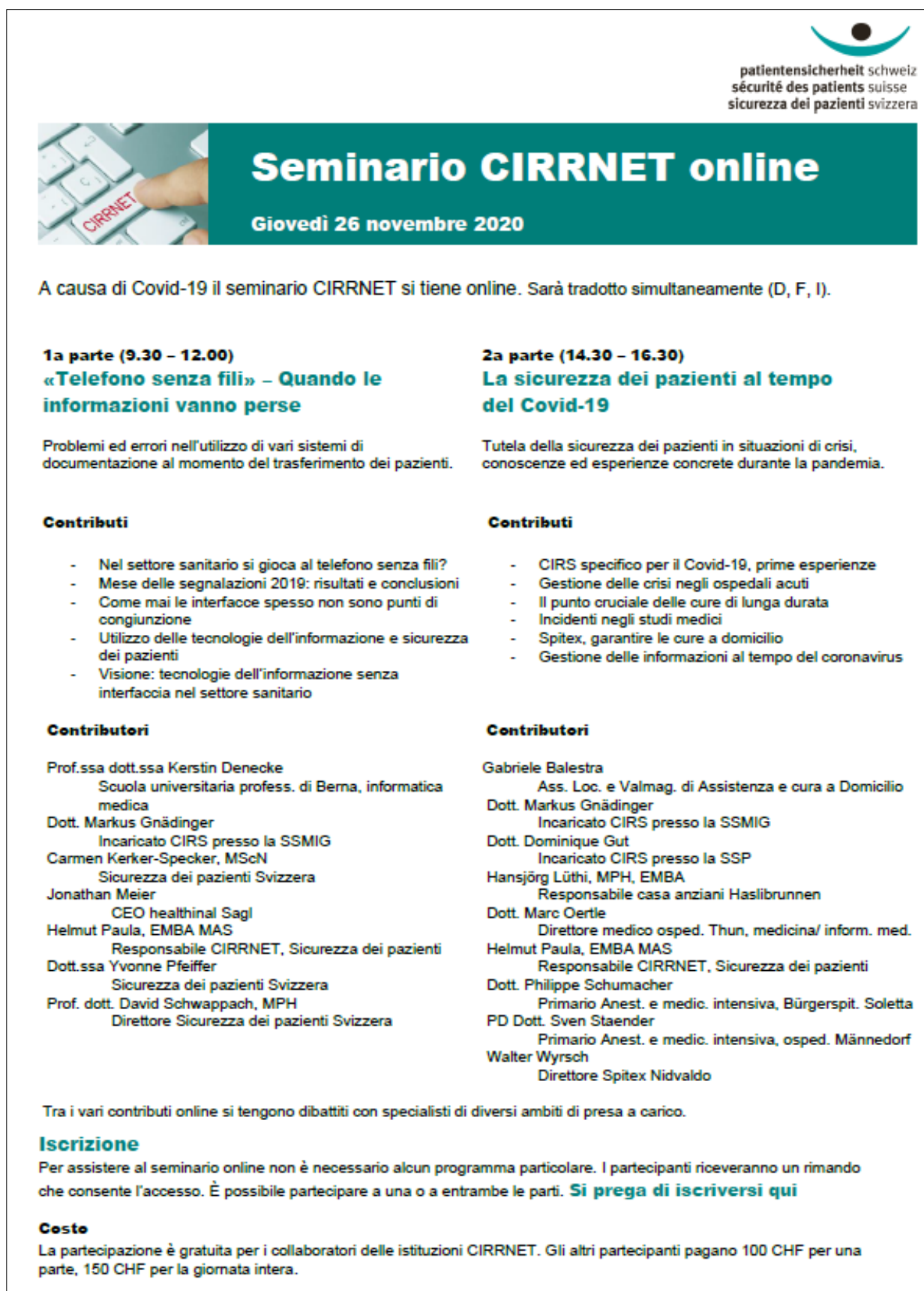
Figura 5: programma e relatori del seminario CIRRNET 2020