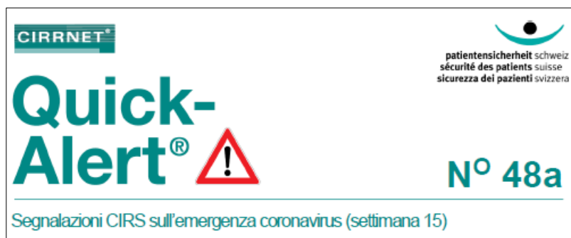
Figura 2: intestazione Quick-Alert® n. 48a°

Poco dopo l'apertura della piattaforma, le segnalazioni rilevavano già i primi importanti problemi legati alla pandemia. Oltre a un sensibile calo della fruizione delle prestazioni soprattutto di medici di famiglia e servizi Spitex, sono state constatate difficoltà ad adeguarsi costantemente alle disposizioni interne, alle raccomandazioni specialistiche e ai regolamenti per il personale specializzato.