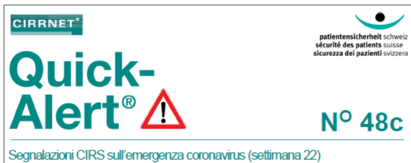
Figura 4: intestazione Quick-Alert® n. 48c

Molte segnalazioni CIRS nell'ambito della gestione della pandemia evidenziano situazioni critiche, per lo più riconducibili a problemi di comunicazione in merito alla diagnosi in corso/richiesta, allo stato infettivo e al sospetto. Si constata che questi problemi si verificano sovente nei punti di interfaccia tra singoli reparti o settori di presa a carico. Ciò non sorprende: nonostante tutti i collaboratori del settore sanitario siano ben coscienti della minaccia rappresentata dal Covid-19 e molte procedure nel frattempo siano ben oliate, i numerosi adeguamenti resi necessari costituiscono una divergenza dalla consueta routine. Si raccomanda pertanto l'utilizzo di strumenti affermatosi nella prassi che garantiscono una comunicazione sicura nel quadro della presa a carico dei pazienti.